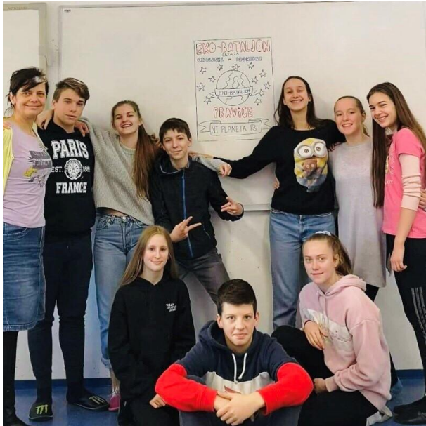
Skupina EKO bataljon v šolskem letu 2019/20.

predstavili svoje ideje in razmišljanja s katerimi bi naša šola postala bolj ekološka (predvsem kaj bi lahko naredili za zmanjšanje količine plastike in odpadkov). Lansko leto pa so se nekateri člani tudi pridružili oddaji Počitniški krompir, v kateri smo predstavili ustrezno ravnanje z odpadki.